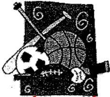
3. la clase de educación física