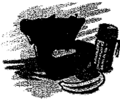
5. el almuerzo