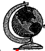
8. la clase de estudios sociales