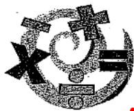
7. la clase de matemáticas