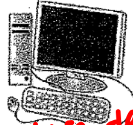
2. la clase de informática