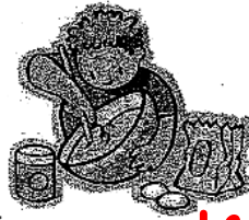
4. la clase de economía doméstica