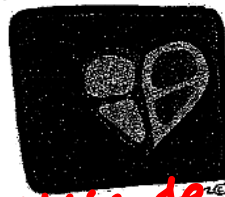
6. la clase de salud