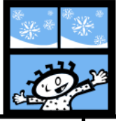
2. la ventana