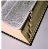
4. el diccionario (dictionary)