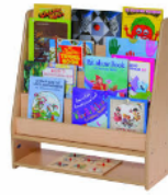
5. los libros