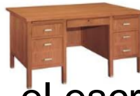
6. el escritorio

Parte 2: Write the synonym in Spanish for each word.