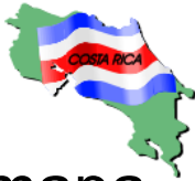
1. el mapa

Parte 1: Write the school supply associated with each picture below.