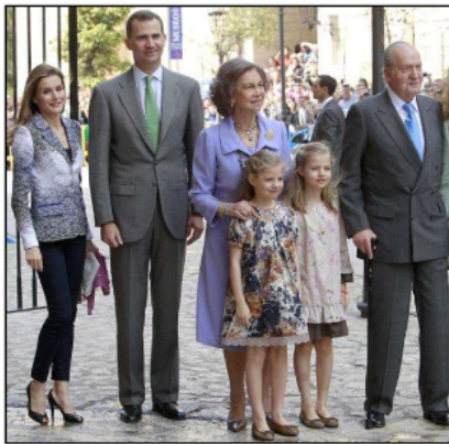
La Familia Real española (2014)