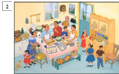
Empanadas (1991) Carmen Lomas Garza