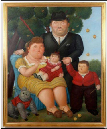
La familia Botero (1989) Fernando Botero