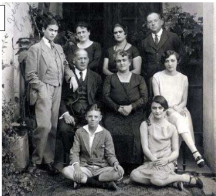
La familia de Frida Kahlo (1926)