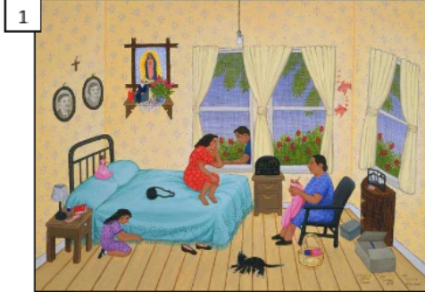
Una tarde (1993) Carmen Lomas Garza