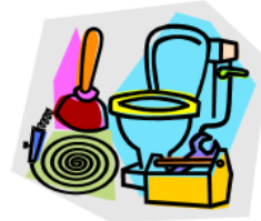
3. el cuarto de baño