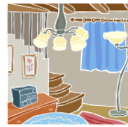
9. el sótano