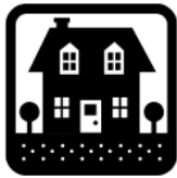
1. la casa

Instrucciones: Escriban las palabras correctas debajo de cada foto.