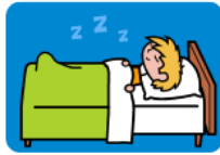
2. el dormitorio