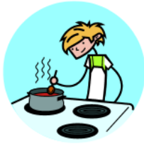
5. la cocina