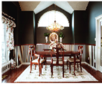
4. el comedor