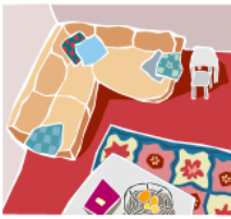
8. la sala