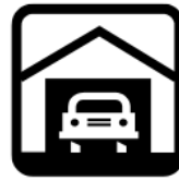
6. el garaje